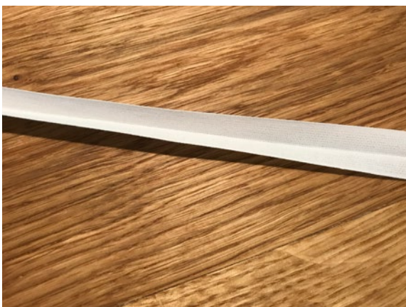
5 Die Baumwollbänder längs falten und bügeln.

Profi-Tipp: Damit die Maske besser anliegt, kann man in den oberen Stoffstreifen einen dünnen Draht (Pfeifenreiner oder Metallstreifen eines Hefters) einnähen.