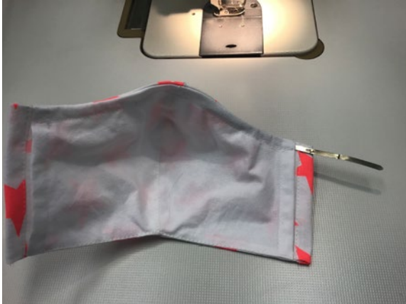
9 Den Draht, Pfeifenputzer oder Metallstreifen (Foto), in den Tunnel schieben.