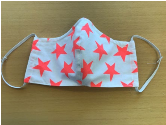
11 Gummibänder auf die gewünschte Länge bringen und zunähen oder verknoten.