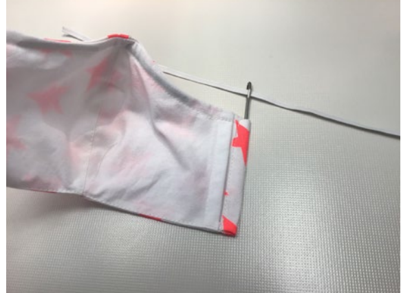
10 An jeder Seite das Gummiband durchziehen.