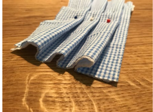
2 Den Stoff in drei Falten legen und feststecken. Anschließend die Falten bügeln.