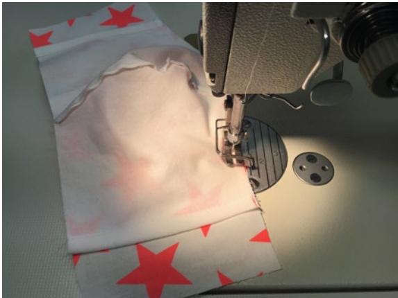
5 Das Oberenteil und das Futterteil rechts auf rechts aufeinander legen, oben und unten füßchenbreit aufeinander nähen.