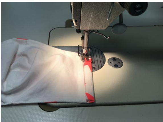
7 Die Seiten des Oberstoffs doppelt einschlagen und schmal steppen (hier wird später das Gummiband durchgezogen).