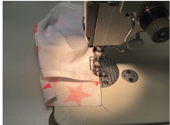
6 Maske wenden und die untere und obere Kante schmal absteppen.