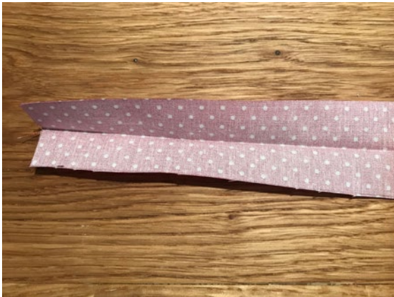
3 Die beiden Stoffstreifen (4x18 cm) längs falten und bügeln.