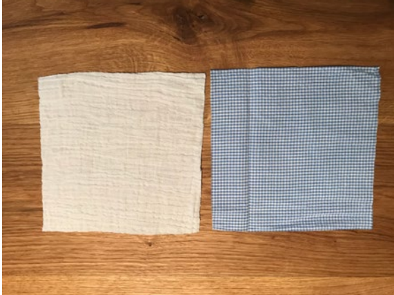
1 Die beiden Stoffstücke (17x18 cm) aufeinanderlegen.