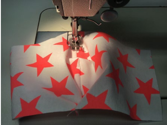
3 Die Nahtzugabe an beiden Teilen zu einer Seite steppen.