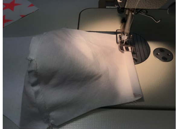
4 Die seitlichen Enden vom Futterstoff doppelt (1+1 cm) einschlagen und absteppen.