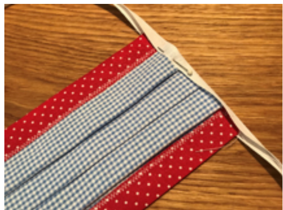
6 Baumwollbänder mittig an den kurzen Seiten der Maske feststecken und mit Zickzackstich festnähen.