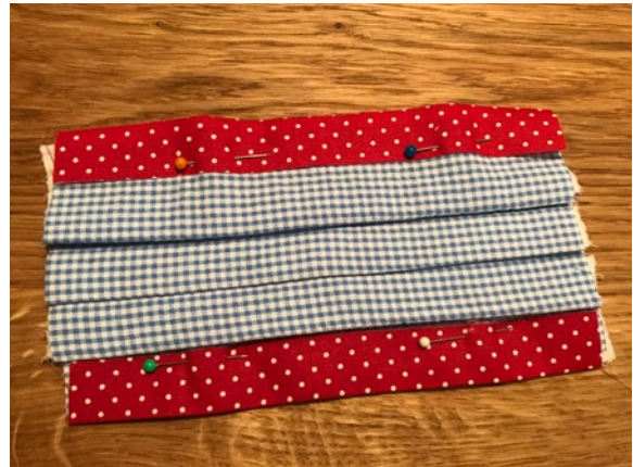
4 Die Streifen oben und unten feststecken und mit Zickzackstich annähen. So verhindert man das Ausfransen.

Profi-Tipp: Damit die Maske besser anliegt, kann man in den oberen Stoffstreifen einen dünnen Draht (Pfeifenreiner oder Metallstreifen eines Hefters) einnähen.